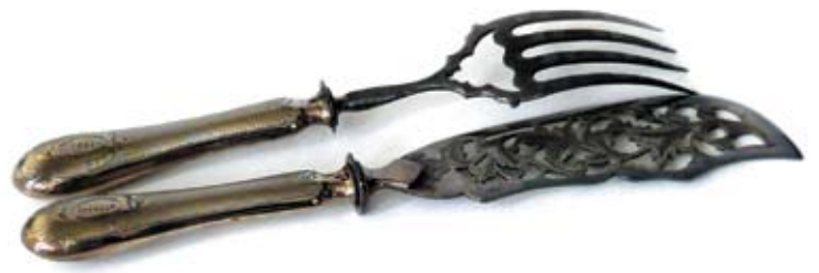
Links: twee zilveren trommels, de ronde voor beschuit, de rechthoekige voor oubliés, op een kristallen blad, 1847. Boven: viscouvert met gravure: Zaandam 1861.